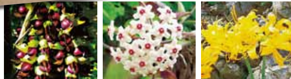
이루란다 개화시기: 3월-4월 사쿠라란 (옥점매) 개화시기: 6월-9월 쇼키즈이센(개상사화) 개화시기: 9월-10월

오키나와 본섬 북부지역은 "안바루(山原)" 라 불리며 이름처럼 짙은 대자연의 색채가 남아있는 아열대의 숲이 펼쳐지고 있습니다. 기근이 늘어진 가주마루(벵골보리수), 울러다 봐야할 만큼 크게 성장한 소철 등 아열대의 나무들이 무성한 숲에서 삼림욕을 즐기세요.