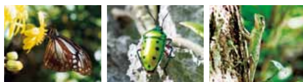
아시키아다라 (왕나비) 나냐뉴시칸카메우시 (광대노린재) 키노보리토카게 (나무타기도마뱀)