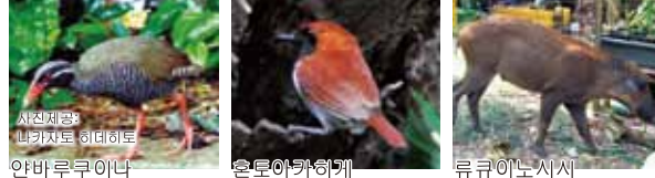
사선제공 반키차토 히데히토 안바루무이나 (흰눈썹뿔부기) 혼노야카하케 (류큐올새) 류큐이노시지 (류큐멧돼지)