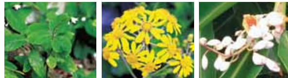
아리모리소 개화시기: 10월-1월 쓰와부키(털머위) 개화시기: 11월-12월 것토(월도) 개화시기: 6월-8월